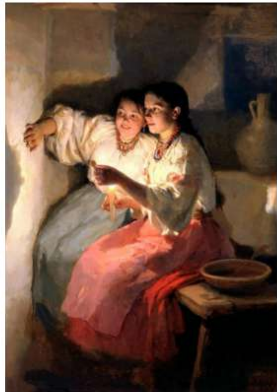
Микола Пимоненко. Ворожіння