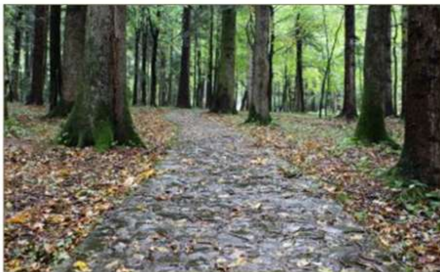
Стежка Івана Франка в Нагуєвичях

У м'якому, вразливому дитячому серці не довго тривали ті турботи. По двох-трьох днях я вже забув про пташка і його нещасну долю. Забув, бачилось, назавсіди. Вражіння могого злочину залягло десь у темнім куті моєї душі, і звільна його присипали, прикрили і погребли інші вражіння, інші спомини.