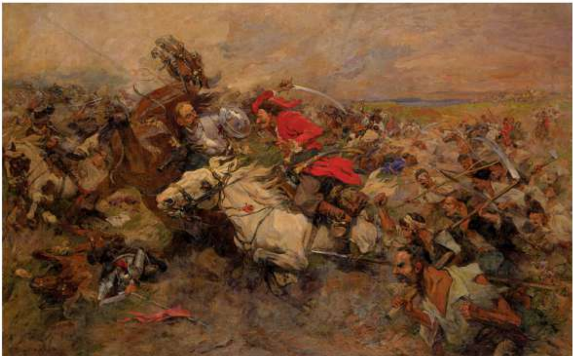
Микола Самокиш. Бій Максима Кривоноса з Ієремією Вишневецьким