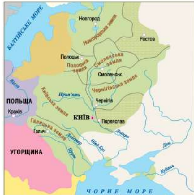
Кордони Руського королівства

А зараз прочитай уривок із оповідання відомого українського письменника Антіна Лотоцького, котрий писав твори на історичну тему.