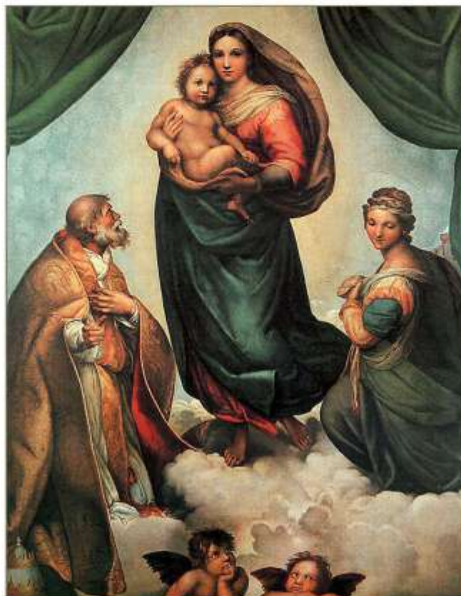
Рафаель Санті. Сікстинська мадонна.