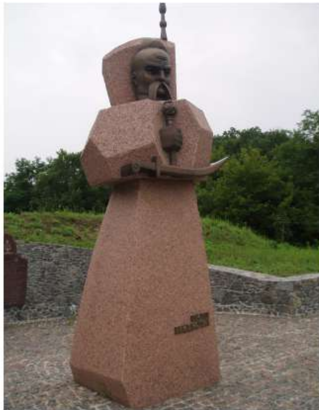
Пам'ятник Іванові Підкові біля Тарасової гори у м. Канів. Скульптор П. Кулик. 2010 р.

Пошукайте в інтернет-джерелах відомості про Івана Підкову. Підготуйте презентацію про цікаві факти з його життя. Долучіть до презентації фоторозповідь про сучасні місця в Україні, пов'язані з іменем Івана Підкови.