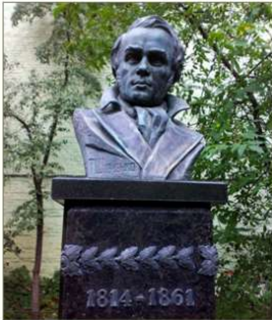
Погруддя на подвір'ї Будинку-музею Тараса Шевченка в Києві. Скульптор Г. Петрашевич

— Поставте, — каже Шевченко до крамаря, — оцей портрет на вітрині. Як хто дасть п'ятсот карбованців — продайте.