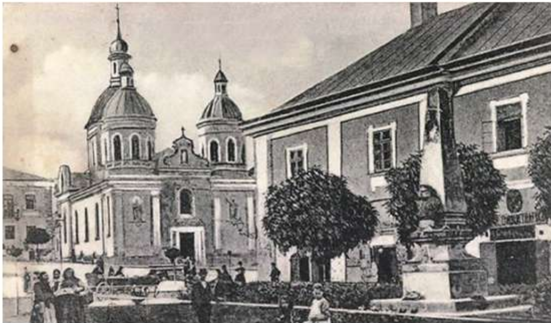
Бережани. Фото 1910 року

Богдан Лепкий (1872–1941) — видатна постать в українській літературі. Письменник, журналіст, поет, літературний критик, перекладач, історик літератури, публіцист. Автор легендарних історичних романів. Співпрацював із товариством «Рідна Школа» щодо видання дитячої літератури, підручників та читанок; укладав читанки для народних шкіл. Упродовж певного часу працював учителем Бережанської гімназії, і саме ці спогади про дороге серцю місто та своє дитинство лягли в основу його повісті «Казка мого життя».