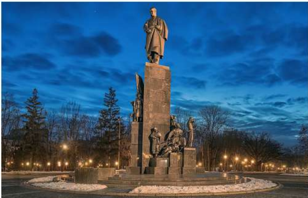
Пам'ятник Тарасові Шевченку в Харкові. Скульптор М. Манізер. 1935 р.

— Звиняюсь, ваша світлосте, але чому ж питаєте, коли самі бачите?