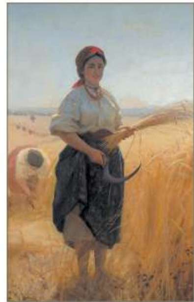
Микола Пимоненко. Жниця (1889)

Жніть, женці, дожинайте, Колосся вибирайте. Колосся вибирайте, Віночки позивайте.