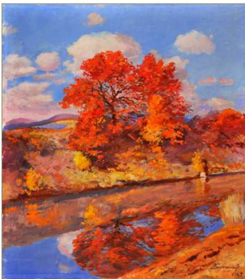
Йосип Бокшай. Осінь