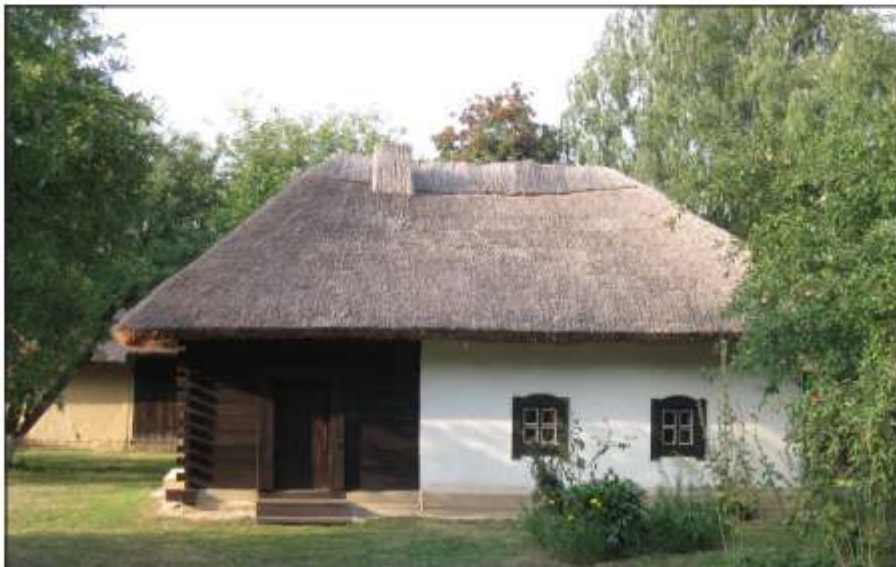
Хата-музей Г. Сковорода у Чорнухах