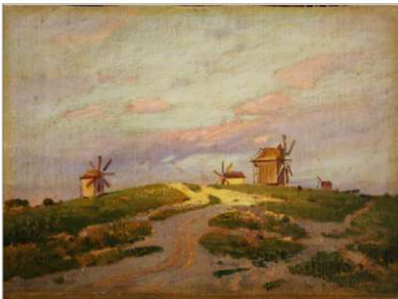
Микола Пимоненко. Млин