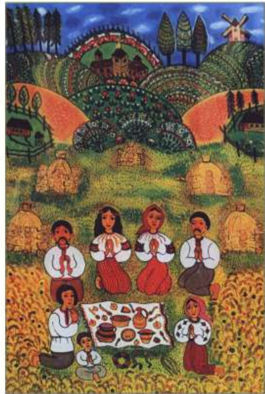
Іван Сколоздра. Жнива