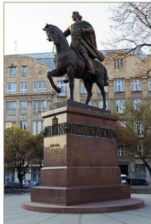
Пам'ятник королю Данилу у Львові