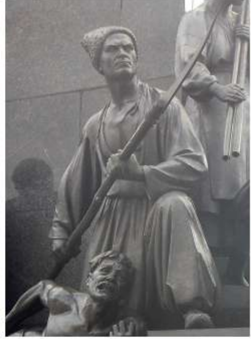
Фрагменти пам'ятника Тарасові Шевченку в Харкові. Скульптор М. Манізер. 1935 р.