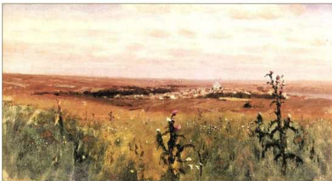
Архип Куїнджі. Степ.