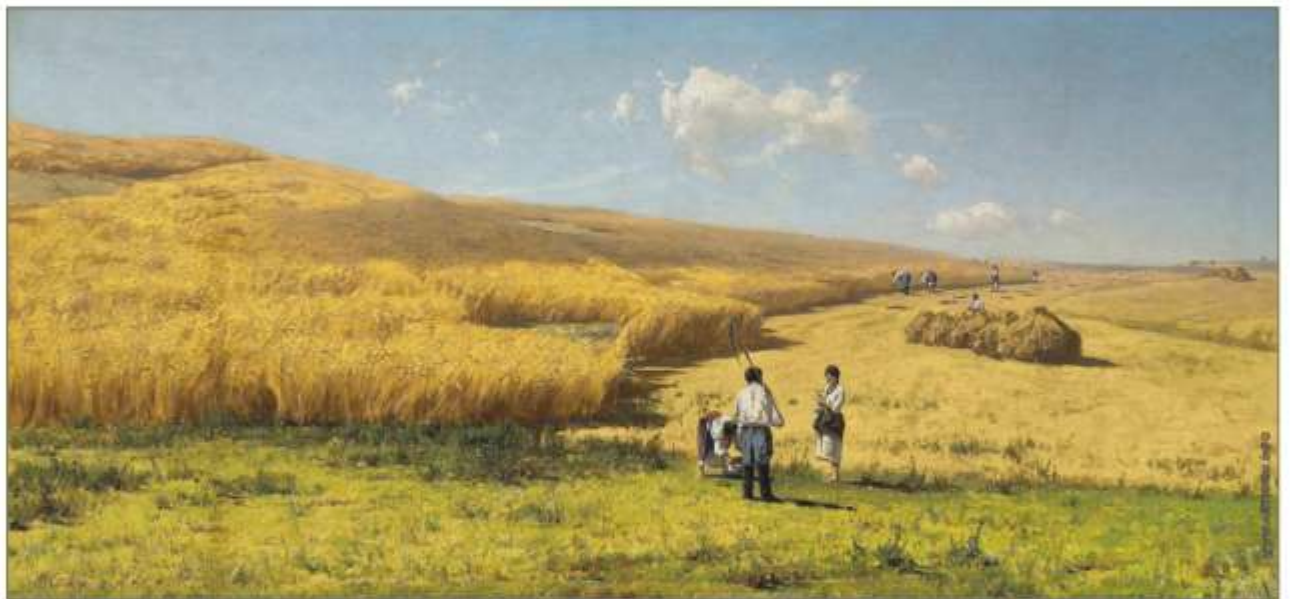
Володимир Орловський. Урожай в Україні (1880)