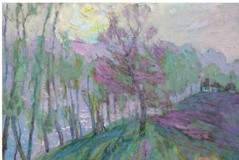
Сергій Глущенко. Перша зелень.