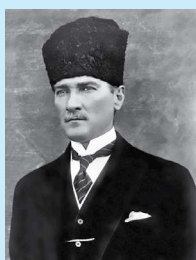
Мустафа Кемаль Ататюрк