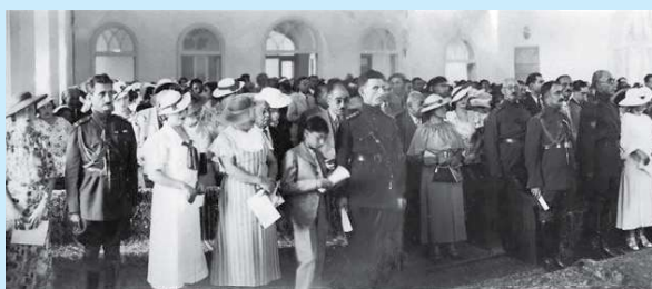
Вищі командири іранських збройних сил, урядовці та їхні дружини відзначають скасування чадри. 1936 р.

Ататюрк прищеплена політичним елітам європейська спрямованість працювала на користь Туреччини. У нову світову війну вона ввійшла нейтральною державою, згодом приєдналася до антигітлерівської коаліції.