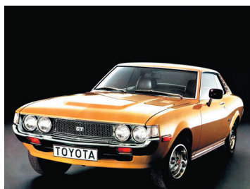
Японський автомобіль «Toyota Celica», 1970–1977 рр.

Nota bene! У 1970-ті роки японська автомобільна промисловість, представлена компаніями Toyota, Nissan, Mitsubishi , стрімко вийшла на світові ринки, насамперед північноамериканський. Розвитку автомобілебудування в Японії сприяло зростання купівельної спроможності населення. А компанії, завдяки державному протекціонізму, мали можливість створювати або купувати найкраще обладнання, що визначило високу якість автомобілів. Крім дизайну і технічної досконалості за відносно низьку ціну, пріоритетами японського автомобілебудування в 1970-х роках стали безпека, комфорт, економічність, екологічність. У дизайні японських автомобілів переважав так званий coke bottle styling , який наслідував стиль американської пляшки з-під кока-коли. Для мешканців СРСР японські автомобілі не були доступними. Єдиним у той час предметом розкоші з японської техніки, символом достатку в Радянському Союзі були магнітоли. Вони коштували від 800 до 3 тис. рублів при середній зарплаті у країні 120–150 рублів.