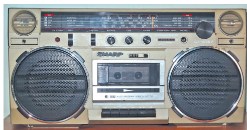
Японська магнітола «Sharp», 1980-ті роки

Стрімке економічне зростання Японії, «японське економічне диво», розпочалося в середині 1960-х років, з приходом до влади кабінету Ейсаку Сато. Найуспішніше розвивалися металургійні галузі промисловості завдяки інвестиціям і найновішим технологіям. Японія першою серед