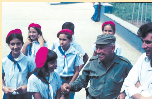
Фрагмент з повсякдення кубинських школярів і школярок. 1970-ті роки