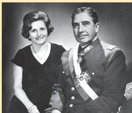
Августо Піночет з дружиною Люсією

нього продукту складав 10 %. Водночас зростали соціальні контрасти, а збільшення кількості інтелігенції створювало ґрунт для наростання опозиційних до режиму настроїв.