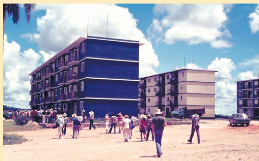
Новобудови на Кубі. 1970-ті роки

проханням збільшити поставки зброї та спорядження, підготувати військових спеціалістів. За цим була спроба розмістити на острові ядерні ракети й бомбардувальники. Вона призвела до так званої Карибської кризи 1962 р., коли тільки завдяки витримці й прямим контактам Джона Кеннеді й Микити Хрущова вдалося уникнути глобального збройного конфлікту. Перед загрозою термоядерного конфлікту Хрущов змушений був відступити: ракетні бази СРСР на Кубі було демонтовано, ракети і війська виведено. Кубинці – противники режиму Кастро (а таких були сотні тисяч) – отримали змогу емігрувати до США.