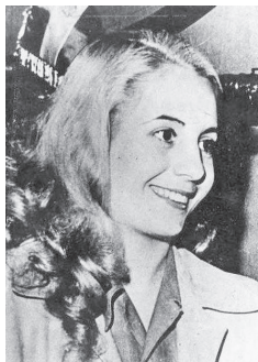
Марія Ева Дуарте де Перон (Евіта)

Велику роль у внутрішньополітичному житті повоєнної Аргентини відігравали дружини Перона. Перша – Марія Ева Дуарте де Перон (1919–1952; більш відома під іменем Евіта), акторка, феміністка, яка допомагала чоловікові проводити популістську соціальну політику й користувалася значною підтримкою серед робітників. За її наполяганням жінки отримали право голосу, а до конституції було включено положення про рівноправність чоловіків і жінок, права людей похилого віку. Евіта фактично керувала міністерствами охорони здоров'я і зайнятості. Друга дружина – Марія Естела Мартінес де Перон (нар. 1931 р.; Ісабель), танцівниця, яку спочатку було обрано на посаду віце-президента, а після смерті чоловіка вона обіймала посаду президента (у 1974–1976 рр.). Ісабель була першою у світі жінкою, яка обійняла посаду президента держави (хоча й не через вибори).