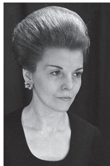
Марія Естела Мартінес де Перон (Ісабель)

Перонізм був поєднанням націоналістичної та антиімперіалістичної риторики, вождизму, опирався на робітничий рух. Правління Перона було спрямоване на врахування інтересів усіх верств населення – як національного капіталу, так і робітників. Економічна стратегія пероністів передбачала прискорену індустріалізацію з акцентом на розвиток імпортозамінного виробництва, обмеження діяльності іноземного капіталу. Однак великий національний капітал, який спершу схвалював заходи уряду щодо витіснення іноземних компаній, поступово почав виявляти