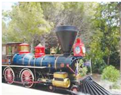
El tren de vapor en el parque PortAventura

¡Hurra! Este fin de semana iremos al parque de atracciones PortAventura cerca de Barcelona. Primero busco información en Internet y hago planes para todo el día.