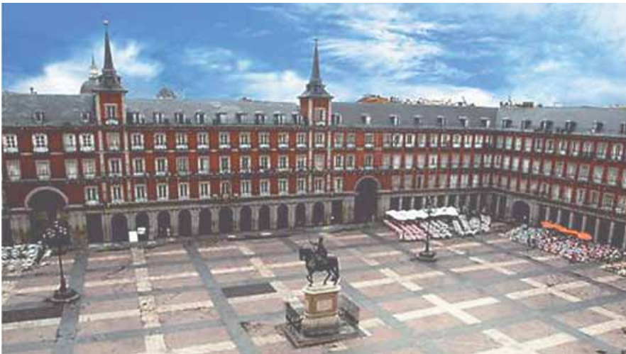
La Plaza Mayor, un lugar de descanso de los madrileños.