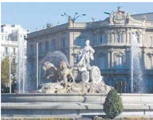
Madrid, la Plaza de Cibeles.