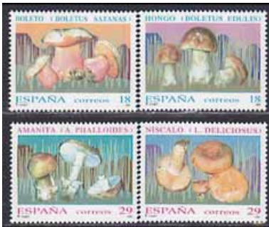
la colección de sellos