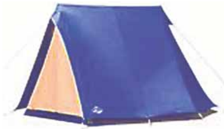
la tienda de campaña