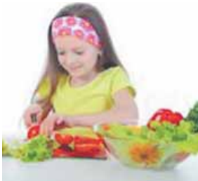
comer frutas y hortalizas