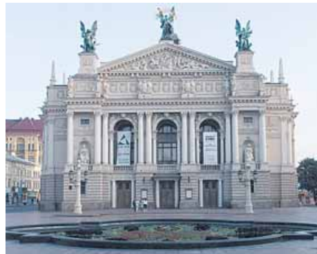
Lviv, el Teatro de ópera y ballet.