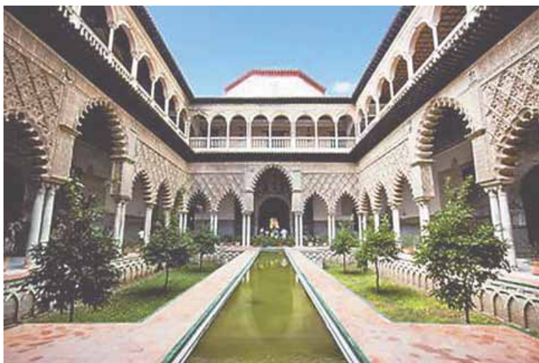
El Real Alcázar (королівський палац) de Sevilla.