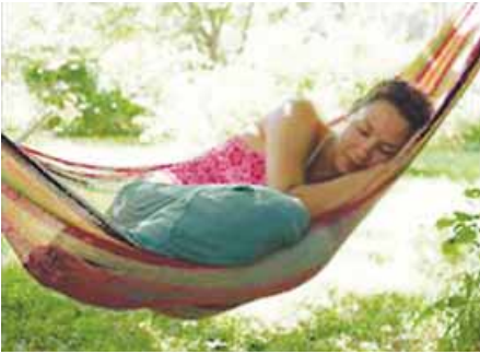
descansar después del almuerzo