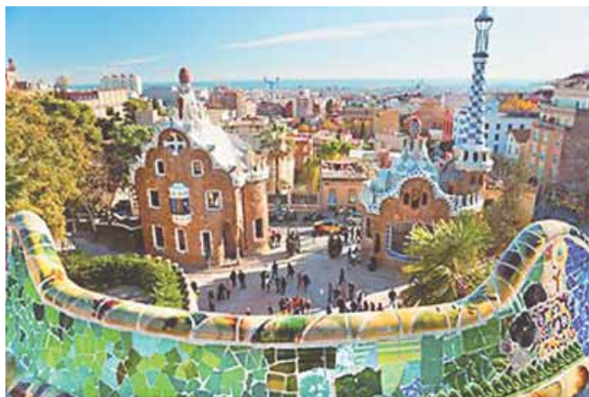
Barcelona, las casas en el Parque Güell del famoso arquitecto Antonio Gaudí.