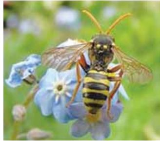
la abeja en la flor