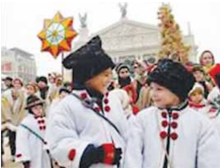
los niños cantan koliadky