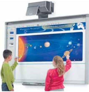
observar el cielo y las estrellas