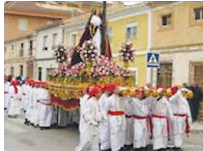
la procesión religiosa