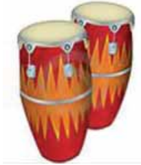
la conga cubana