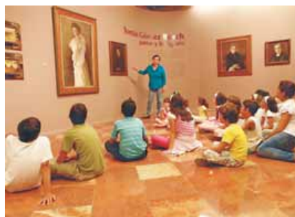
La visita a la galería de pintura.