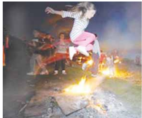
La chica salta por encima de la hoguera.