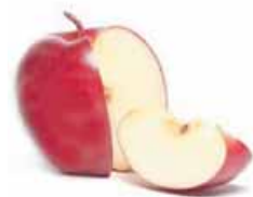
un trozo de manzana