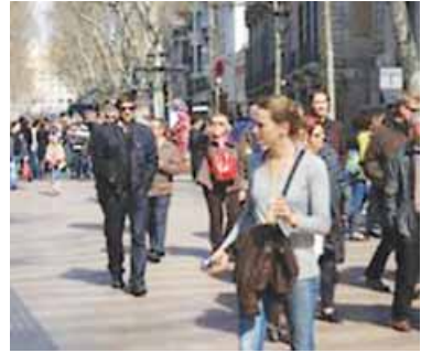
ir de paseo y ver a la gente