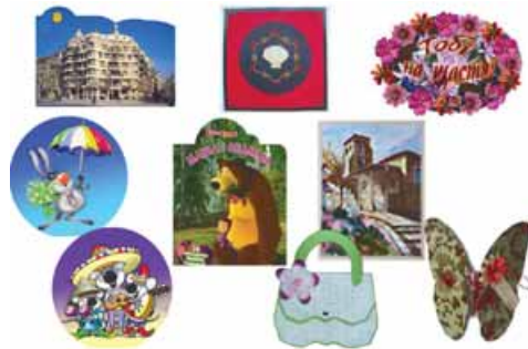
la colección de imanes