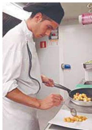
el cocinero en la cafetería