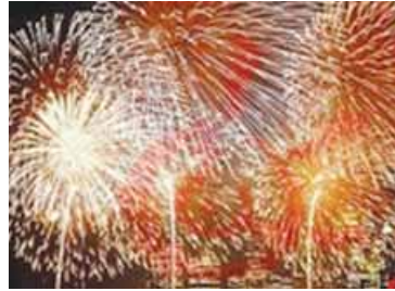
los fuegos artificiales