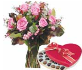
llevar un regalo, las flores y los dulces