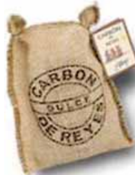
el carbón de los Reyes Magos