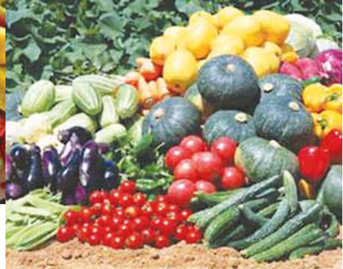
las hortalizas del huerto