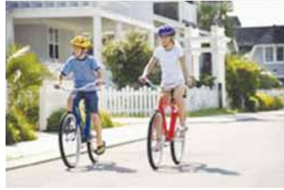
montar en bici