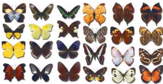
la colección de mariposas