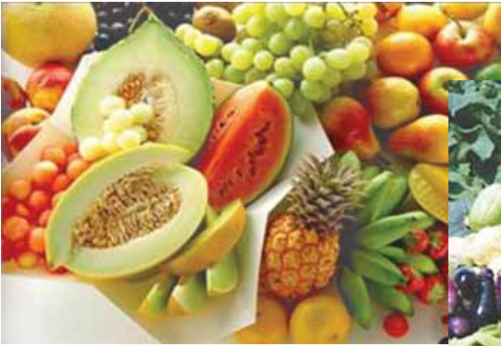
las frutas del jardín