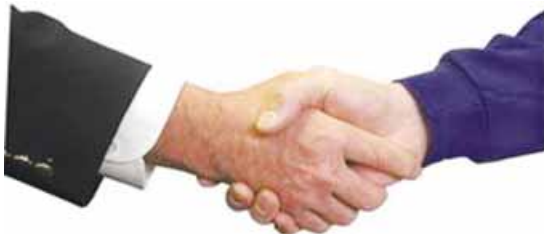
apretar la mano al saludar y al despedirse