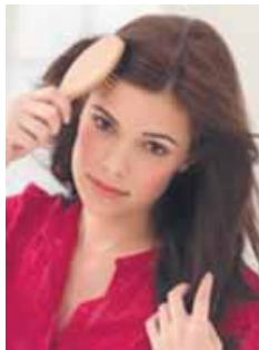
cepillarse el pelo