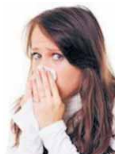
taparse la nariz