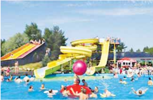
el parque acuático