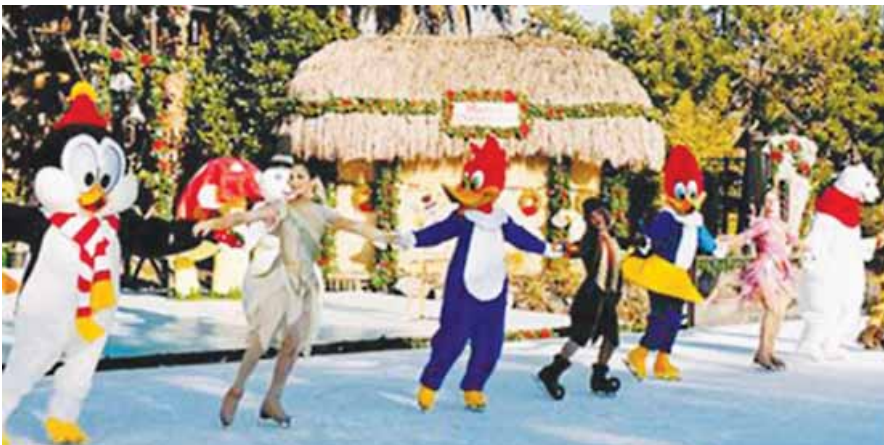
el espectáculo al aire libre