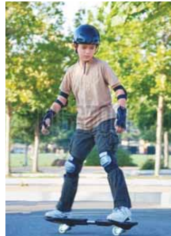
montar en patineta

el amigo de verdad – справжній друг montar en patineta – кататися на скейті hacer saltos – виконувати стрибки chocar con – зіткнутися з ( чимсь ); наштовхнутися на ( щось ) ¿Qué te pasa? – Що з тобою? me duele – у мене болить ¿Cómo voy a casa? – Як я дійду додому? me sienta – саджає мене