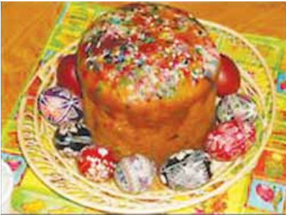
los pýsanky y el pan de Pascua