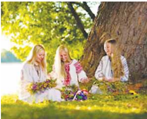
Las chicas hacen coronas de flores.

El 7 de julio, se celebra en Ucrania el día de Iván Kupala. Esta fiesta se considera el solsticio de verano. Se hacen hogueras cerca de los ríos. Los chicos y las chicas saltan por encima de las hogueras. Las chicas recogen plantas y hacen coronas de flores. Después las ponen en el río para prever su suerte.