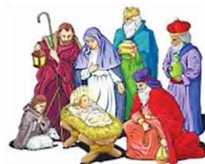
el pesebre de Navidad