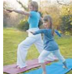
hacer ejercicios físicos por la mañana