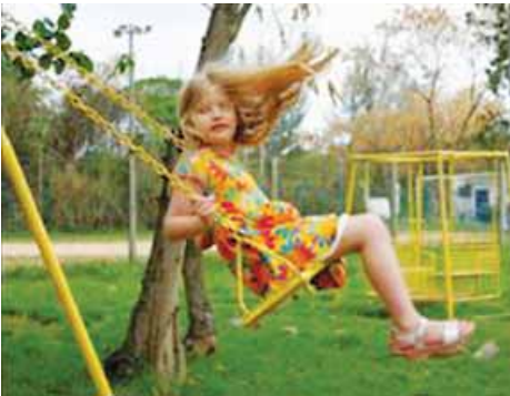
columpiarse en el columpio