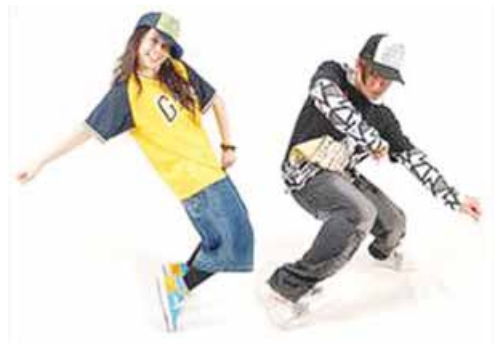
practicar bailes deportivos