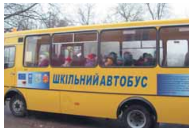
el autobús escolar

En la escuela hay muchas clases, un gimnasio, una biblioteca, una sala de actos y un comedor. Muchas clases están equipadas con