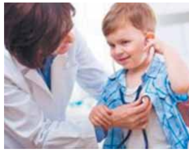
hacer revisiones médicas