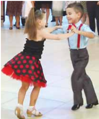
los bailes de salón