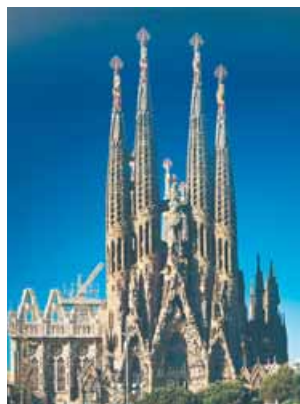
Barcelona, la catedral de la Sagrada Familia.