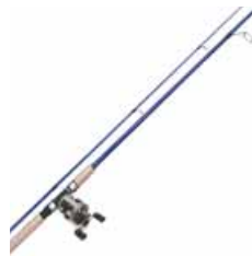
la caña de pesca