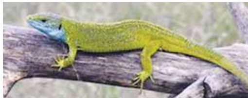
la lagartija →