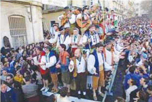
El Carnaval en Cádiz. Una agrupación musical canta en la calle.