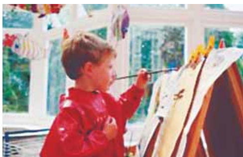
En clase de educación plástica.