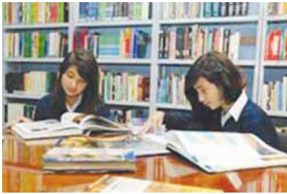
buscar información en la enciclopedia