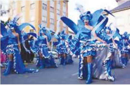
los disfraces de carnaval