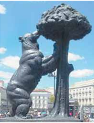
La estatua del Oso y el Madroño (суничне дерево).