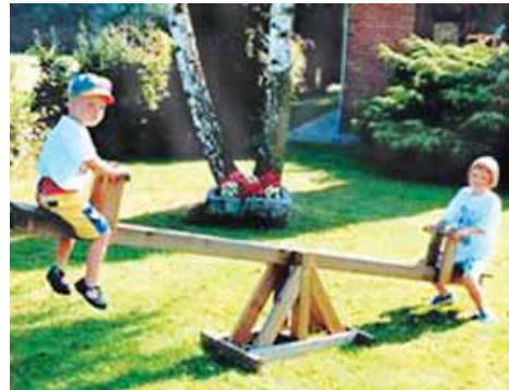
columpiarse en el balancín