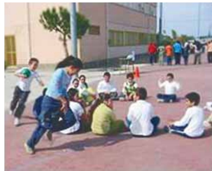
jugar al ratón y el gato