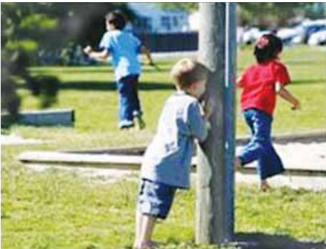
jugar al escondite