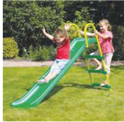
deslizarse por el tobogán

el tiempo de ocio – дозвілля el tiempo libre – вільний час jugar al escondite – грати у піжмурки jugar al ratón y el gato – грати у кота й мишу saltar a la comba – стрибати через скакалку columpiarse – гойдатися el columpio – гойдалка