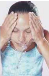
lavarse la cara