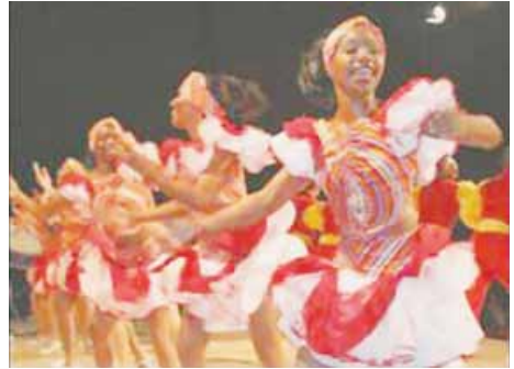
El Carnaval en La Habana. Las bailarinas bailan la conga en las calles.