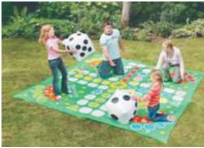
estar al aire libre