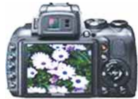
la cámara digital