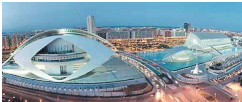
Valencia, la Ciudad de las Artes y las Ciencias.