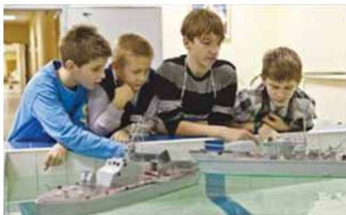
el modelismo naval