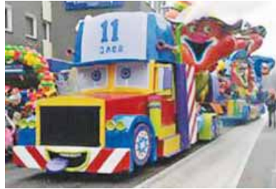
la carroza de carnaval