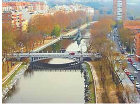
El río Manzanares pasa por la ciudad de Madrid.