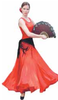
el imán: el traje nacional