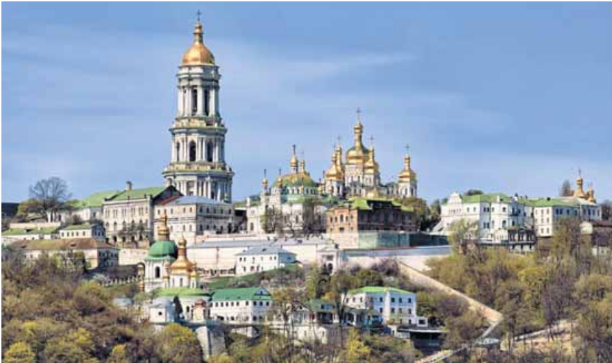
Kyiv, el monasterio Lavra Pecherska.