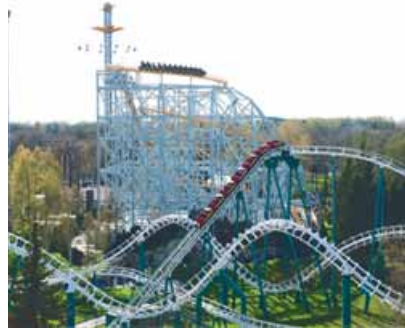
el parque de atracciones (las montañas rusas)