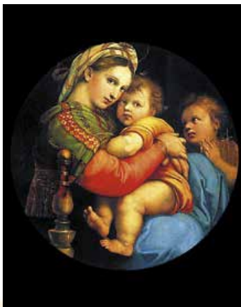
Рафаель. Мадонна в кріслі. 1513–1514 рр.

Погляньте на обличчя сучасників Шекспіра, людей XVI ст., якими їх зрозуміли й показали нам тогочасні художники. І портрет принцеси, і портрет простої жінки в образі матері Ісуса (вона теж була простого роду), і, зрештою, автопортрет митця є «дзеркалом» душі, а не соціального статусу.