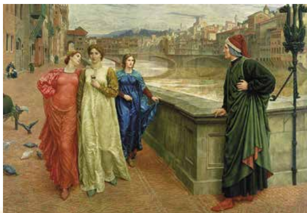
Г. Холідей. Данте і Беатріче. 1883 р.