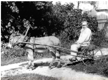
А. Фет – поміщик. Фото др. пол. XIX ст.

У 1873 р. нарешті збулася заповітна мрія Фета: він став Шеншиним. Дворянство, яке поетові не вдалося здобути на військовій службі, цар подарував видатному підприємцеві й суспільному діячу. Аби назавжди покінчити з «ненависним Фетом», Афанасій Афанасійович продав створену власною працею Степанівку і купив розкішний аристократичний маєток Воробйовка в Курській губернії. Однак бажаної цілісності особистості багатий поміщик-дворянин Шеншин так і не відчув. Перемогти в собі поета Фета йому не вдалося. Одна за одною друком виходять п'ять