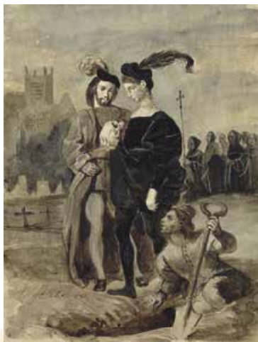
Е. Делакруа. Гамлет і Гораціо на цвинтарі. 1839 р.

З покоління «батьків» ніхто не гідний ні дружби Гамлета, ні його поваги. Серед цих людей – тільки двоє порядних, та й ті померли (батько Гамлета й блазень Йорик). Таке світовідчуття є типовим саме для молодіжної літератури – усім керують непорядні «батьки», давно вже втрапивши на це право.