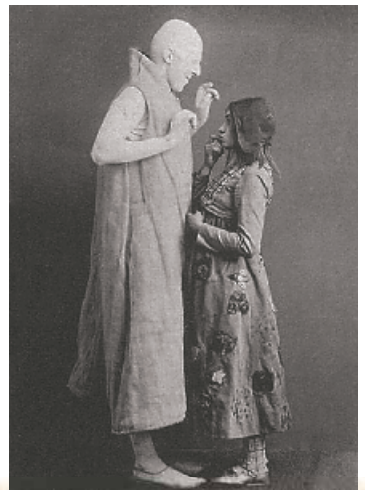
Сцени з вистави «Синій птах». Московський художній театр. 1908 р.

Уся драматургія Метерлінка афористична, тобто сповнена поетичних узагальнень повсякденного людського досвіду. Як і Бодлер та його послідовники – французькі поети-символісти Верлен, Рембо, Малларме, Метерлінк знайшов потрібну рівновагу в символізмі. Символістичний твір сприймається водночас у двох площинах: чуттєві образи, зрозумілі навіть дитині, і абстрагований зміст. Сучасні драматургу критики порівнювали подвійність сприйняття його творів зі спостереженнями за зоряним небом: можна просто дивитися на нього захоплено, а можна бачити, як астроном у телескоп, далекі, недосяжні для ока світи.