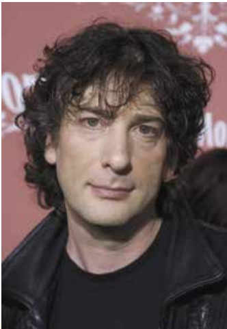
Фотопортрет Н. Геймана. 2007 р.

«Ви знаходите в книжках децю життєво важливе для існування в цьому світі: світові не обов'язково бути саме таким. Усе може змінитися». На цьому відкритті Гейман будує і власне життя, і свою творчість. А разом із письменником власні світи, непідвладні законам фізики, створюють його читачі.