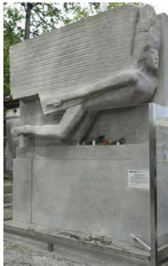
Дж. Епстайн. Пам'ятник О. Уайльду на цвинтарі Пер-Лашез. Париж. 1914 р.