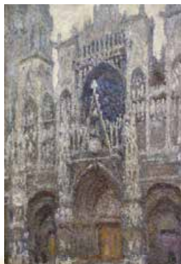
К. Моне. Руанський собор, похмура погода. 1894 р.