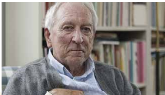
Фотопортрет Т. Транстремера. 2014 р.

Свіжий погляд на реальність? У застарілих, класичних формах? Але ж іще від часів Бодлера вважається, що новий погляд обов'язково вимагає нових форм – хіба не так? Спробуймо з'ясувати.