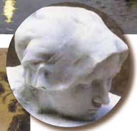
О. Роден. Думка. 1886 р.