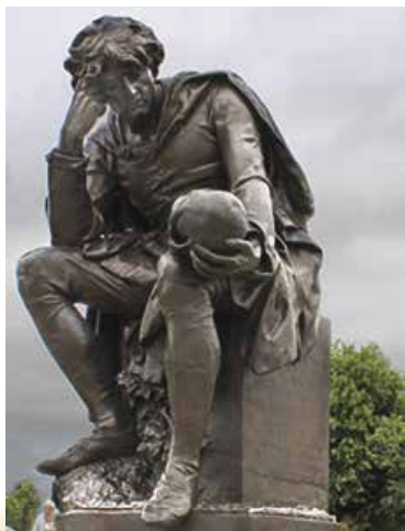
Р. Гауер. Скульптура Гамлета з меморіалу «Пам'ятник В. Шекспіру». Стретфорд-на-Ейвоні. 1888 р.

Принц самотній, якщо вважати його тільки сином своїх батьків, свого роду й народу. Самотній у родині, самотній у Данії, яку називає в'язницею. Проте Гамлет знає й іншу, крім любові-сторге, любов – любов-філео, тобто дружбу. Саме вона пов'язує тридцятирічного принца з його ровесниками й з тими, хто молодший за нього. Як і Дантова «Комедія», «Гамлет» – твір молодіжний, пройнятий відчуттям єдності покоління. Доба Відродження відчуває себе молодістю Європи, доба Єлизавети I – молодістю Англії. Обидві вони більше за будь-які інші переймаються проблемами молоді. Творчість Шекспіра – перехрестя цих епох, і в центрі його – «Гамлет».