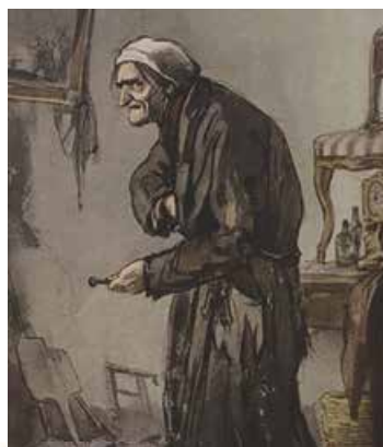
Кукринікси. Плюшкін. 1952 р.