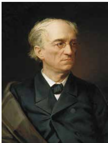
С. Александровський. Портрет Ф. Тютчева. 1876 р.

Федір Іванович Тютчев (1803–1873) – російський дворянин пушкінського покоління. Він лише на чотири роки молодший за Пушкіна і на цілих одинадцять років старший за Лермонтова. Однак, на відміну від Пушкіна й Лермонтова, які намагалися перебороти в собі романтиків, Тютчев не поспішав прощатися з ідеалами молодості. Почасти цьому сприяло те, що в дев'ятнадцять років, після навчання на словесному відділенні Московського університету, поет вступив на дипломатичну службу і двадцять два роки прожив у маленькій, спокійній Баварії. Його ровесники й знайомі в Росії брали участь у повстанні декабристів, зазнавали переслідувань від Миколи I, словом, так чи так мусили змінюватися чи пристосовуватися. Тим часом Тютчев у затишному Мюнхені, серед мальовничих гірських пейзажів тільки поглиблював те світовідчуття, яке ще в ранній юності засвоїв від німецьких романтиків.