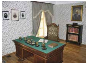
Кабінет А. Фета в маєтку Воробйовка