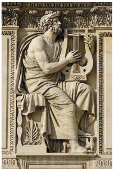
А.Д. Шодє. Гомер. 1806 р.

Отже, коли віра в священність міфу підупала, греки зрештою отримали своє «святе письмо». Тепер у них був текст, на який завжди можна було послатися, обстоюючи власну віру. Афіняни навіть встановили святкові дні, протягом яких збиралися на агорі, де рапсоди, змінюючи один одного, виконували епопею Гомера.