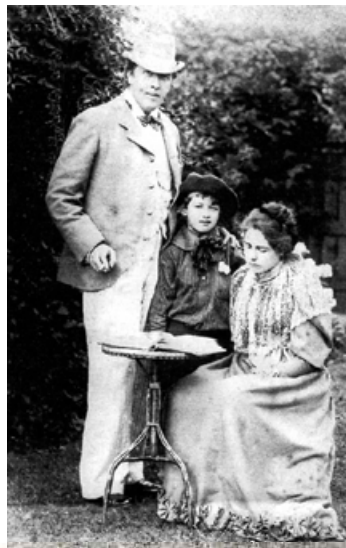
О. Уайльд із дружиною та сином Сирілом. Фото 1892 р.