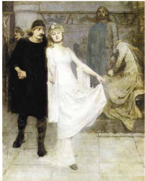
М. Грейфенхаген. Лаерт і Офелія. 1885 р.

Гамлет завинив перед Офелією. Він стривожив розум дівчини, який досі перебував у гармонії із собою і світом. Зрештою принц випадково (для себе, але не для трагедії в цілому) убив її батька. Так удаване божевілля Гамлета зловісно відгукнулося в долі Офелії, спричинивши її справжнє божевілля і смерть.