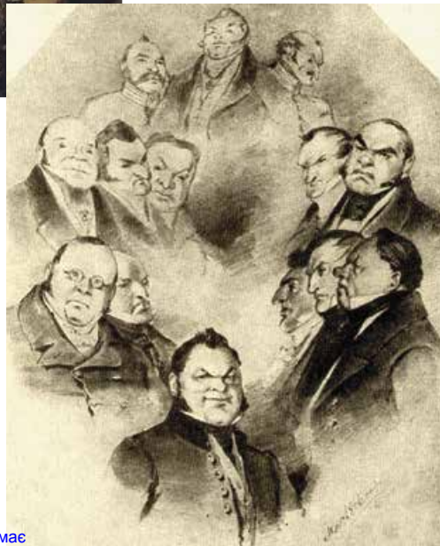
П. Боклевський. Губернський олімп (чиновники губерньського міста NN). 1866 р.