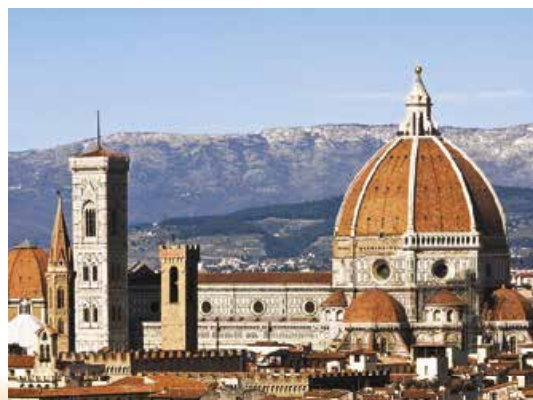
Собор Санта-Марія-дель-Фйоре. Флоренція

Італію кінця XIII ст. можна назвати гідною спадкоємицею Римської імперії. До її складу входили міста, кожне з яких мало певну самостійність на зразок міст-держав античності. Як ви знаєте, Данте був уродженцем багатого торгового міста Флоренції. Нащадок знатного й заможного роду, поет отримав ґрунтовну освіту в приватній школі, студіював юриспруденцію, філософію і теологію в університетах Болоньї та Парижа, тож по праву зажив слави найосвіченішої людини свого часу. Протягом усього