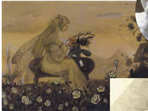
І. Капралова. Гофман «Крихітка Цахес». 1998 р.