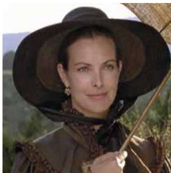
Пані де Реналь у виконанні К. Буке