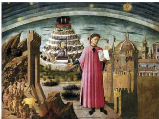
Д. ді Мікеліно. Данте в «Божественній комедії». Фреска із собору Санта-Марія-дель-Фйоре. 1465 р.

В одному з листів Данте зазначив, що його «Божественна комедія» – твір алегоричний , на зразок Біблії. Кілька тлумачень мають і наведені рядки. Перше значення – прямий зміст тексту: людина вже немолода, але й не в літах (серединою життя за часів Данте вважали тридцять п'ять років), заблукала в повному небезпек лісі. Друге значення алегоричне: поет утратив життєву мету, потрапив у ліс людських помилок. Є і третє значення – алегорія політична: дрімучий ліс – це політичне життя Італії, у якому Данте брав безпосередню участь.