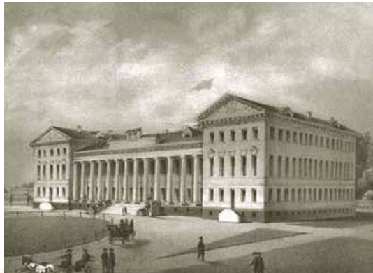
Гімназія вищих наук у Ніжині. Малюнок першої половини XIX ст.

Ви вже знаєте, що юні представники найдавніших боярських родин, як-от Голіциних, Пушкіних та інших, уже від 1811 р. готувалися «присвятити себе Вітчизні» в Царськосельському ліцеї. Результатом елітного виховання було щире прагнення ліцеїстів особисто вирішувати долю Росії. Відповідальність за свою країну вони не могли покласти ні на людей «низького походження» (таких, як улюбленець Петра I князь Меншиков, що розпочинав свою «кар'єру», торгуючи млинцями), ні на «іногородців», як Безбородько. «Не торгував мій дід млинцями... // в князі з хохлів він не стрибає» , – писав Пушкін у вірші «Мій родовід».