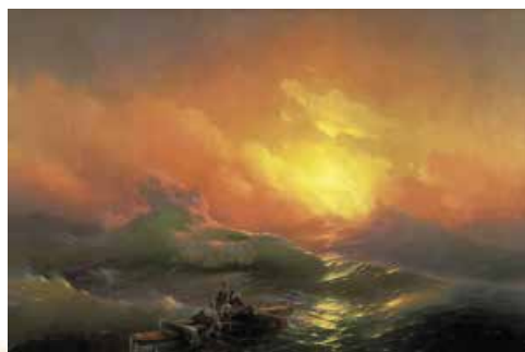
І. Айвазовський. Дев'ятий вал. 1850 р.

Від самого початку романтизму просвітницький культ розуму поступився місцем культу почуття. На зміну людині XVII–XVIII ст., яка спочатку мислить, а вже потім існує, прийшла нова – романтична – особистість, що всім серцем віддається буттю, поринає у пристрасті.