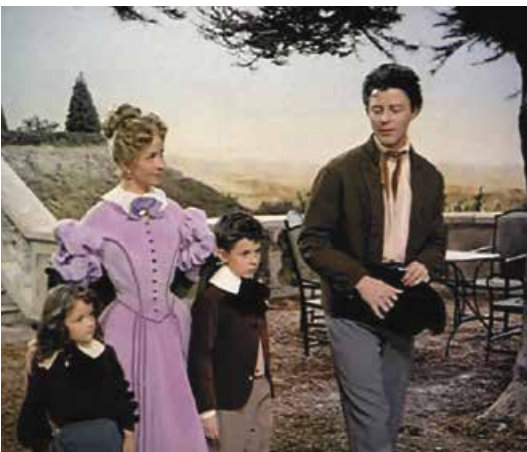
Кадр із кінофільму «Червоне і чорне» (режисер К. Отан-Лара, 1954 р.)

Назва підрозділу містить дві характеристики Жульєна Сореля. За змістом вони збігаються. Першу характеристику дав героєві автор, коли Жульєн запідозрив, що любовний лист Матильди – знуцання, друга – самохарактеристика Сореля на суді. Перша цитата – характеристика героя романтичного. Однак такий герой не може бути простолюдином, тому Сорель перетворюється на героя типового – «бідного тесля з Юри». Ця двоїстість образу – його романтико-реалістична природа – і зумовлює суперечливість вдачі героя.