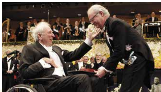
Т. Транстремер отримує Нобелівську премію. Фото 2011 р.