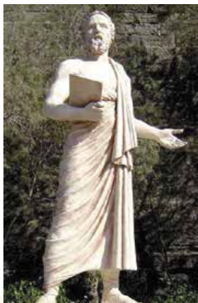
Пам'ятник Геродоту. Бодрум

Коли Геродот побачив єгипетські піраміди, він не відчув священного трепету, ба більше – висміяв погляд єгиптян на велич і славу. «Батько історії» був переконаний, що людина не може уславитися у віках лише завдяки монументальній гробниці. Сьогодні можна сказати: формально Геродот неправий. Проте – лише формально.