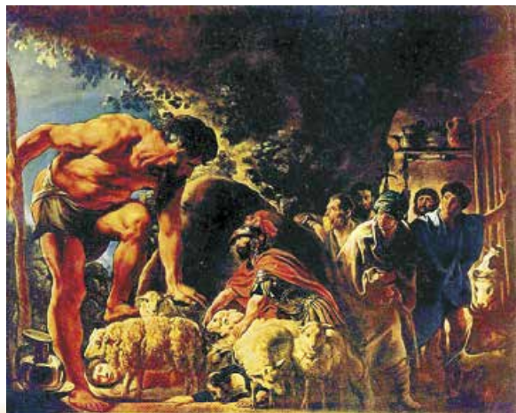
Я. Йорданс. Одисей у печері циклопа Поліфема. Перша половина XVII ст.

Коли Поліфем наказує Одисеєві назватися, герой відповідає: «Ніхто». Так, він «ніхто» перед могутнім велетнем, уособленням ворожих людині природних і надприродних сил. Навіть погроза вже переможеного «Поліфема премогутнього» – «Клятий Ніхто, не втече він, кажу, від загибелі злої» – звучить досить переконливо, зважаючи на те, хто його батько.