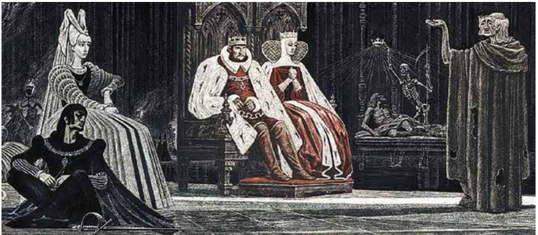
С. Бродський. Ілюстрація до трагедії «Гамлет». 1970-ті роки

Від монологу до монологу характер Гамлета дедалі більше розкривається глядачеві (читачеві). Уперше герой з'являється на сцені в натовпі персонажів, але мусить привернути до себе увагу якоюсь ще ледь відчутною незвичністю поведінки. Раптом усі зникають, і принц залишається на самоті. Пригнічений спілкуванням з дядьком і матір'ю, він виголошує свій перший монолог: «Коли б ця плоть моя, міцна занадто, // Розтала, зникла, скапала росою!» .