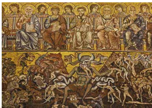
Фрагмент мозаїки XIII–XIV ст. з баптистерію Сан-Джованні. Флоренція