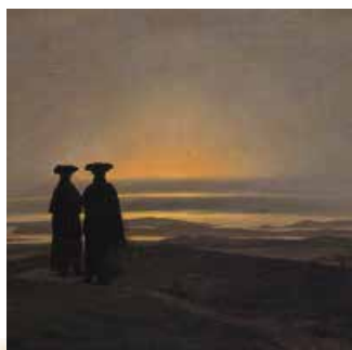
К.Д. Фрідріх. Захід сонця. 1830–1837 рр.