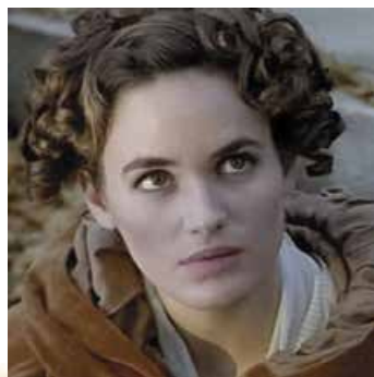
Матильда де ла Моль у виконанні Ж. Гордеш