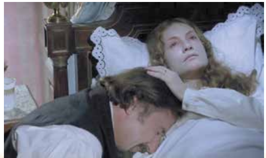
Кадр із кінофільму «Мадам Боварі» (режисер К. Шаброль, 1991 р.)