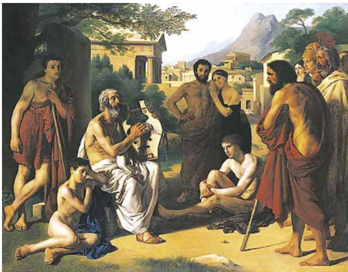
П. Джоєрді. Гомер співає свої вірші. 1834 р.