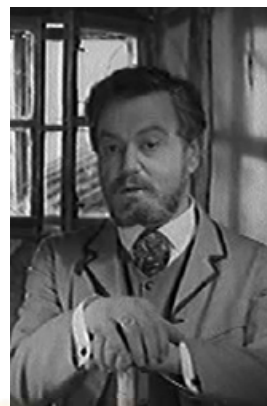
Кадр із кінофільму «Злочин і кара» (режисер Л. Куліджанов, 1969 р.)

Зауважмо, що на самоті Раскольніков розмірковує так, ніби говорить із живими співрозмовниками. Щойно познайомившись із головним героєм, через його думки ми вже вступили в діалог з іншими персонажами роману. Любляча мати, голос якої ми почули з листа до сина; сестра Дуня, намір і голос якої мати передала в листі; Мармеладов, який, вилившись у монологі перед Раскольніковим, став його реплікою в діалозі... Утім тепер це вже не діалог, а полілог, бо багато інших голосів долучилося до розмови про те, чи й справді людина є «падлюкою» і що з того випливає.