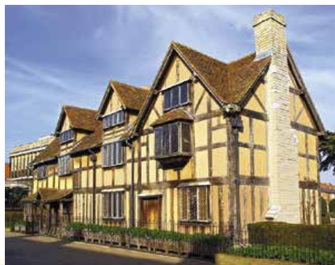
Будинок-музей В. Шекспіра. Стретфорд-на-Ейвоні