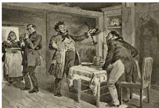
В. Маковський. Ноздрів і Чичиков зустрічаються в трактирі. 1901–1902 рр.