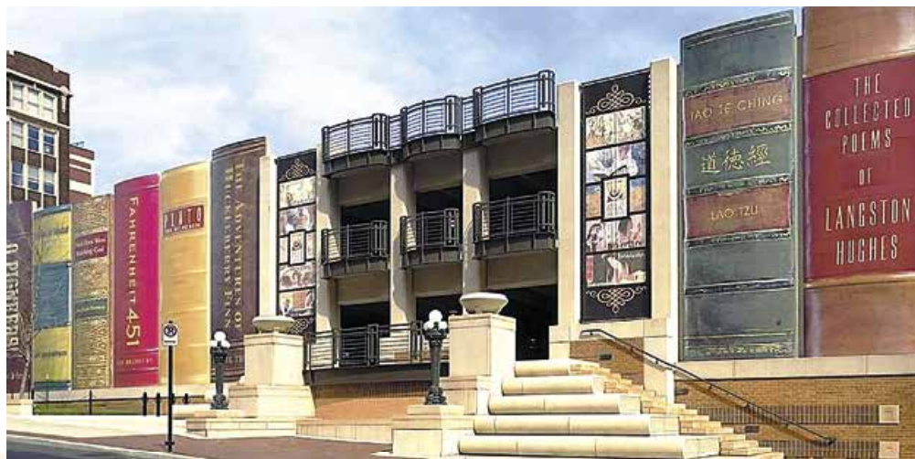
Громадська бібліотека в м. Канзас-Сіті. США