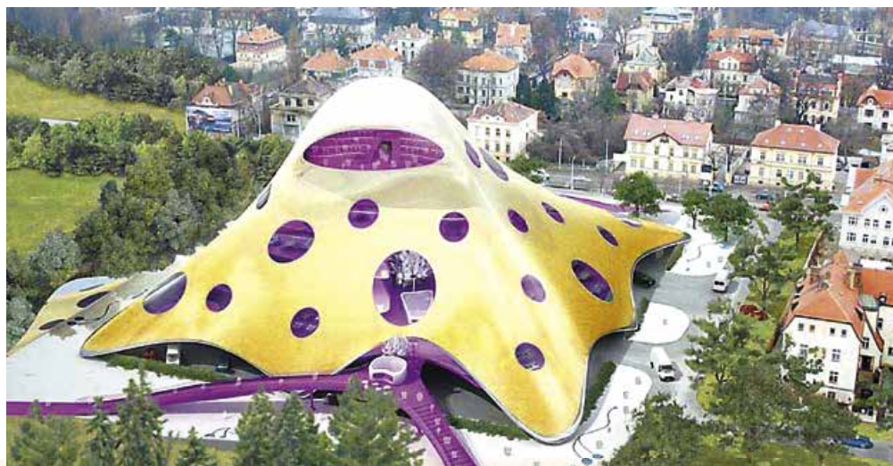
Національна бібліотека Чехії. Прага