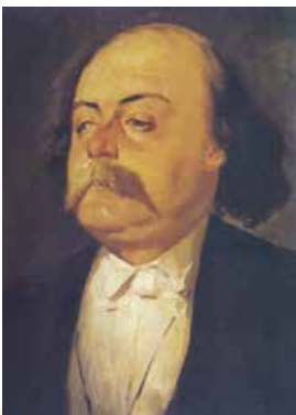
П.Ф. Журо. Портрет Г. Флобера. 1856 р.

1848 рік. Флобер, на відміну від свого ровесника Достоевського, на той час ще нічого вартого уваги не написав. Аж ось нагода: Франція переживає бурхливі події. Проте Гюставу швидко набридло спостерігати чергову французьку революцію, і він вирушив на Близький Схід.