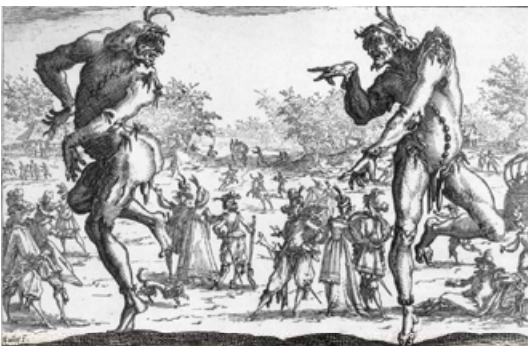
Ж. Калло. Два театральних персонажі. 1616 р.

У жовтні 1819 р. Гофмана призначили членом слідчої комісії, створеної за наказом пруського короля нібито для викриття зрадників держави під час війни з Наполеоном, а насправді – для переслідування інакодумців. Як член комісії письменник став на захист обвинувачуваних (здебільшого студентів), після чого поліція почала переслідувати його самого. Ще одним приводом стала нова повість Гофмана «Володар бліх», де в зловісному образі наклепника Кнарпанті можна було впізнати реального шефа поліції фон Кампца. Про це дізналися ще до публікації твору, тож за наказом уряду рукопис було конфісковано. І попри все тяжко хворий, паралізований, зламаний фізично, але не морально Гофман диктує закінчення «Володаря бліх», а також свій останній твір «Кутове вікно». 25 червня 1822 р. письменника не стало.