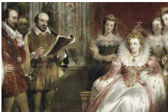
Дж. Дж. Шалон. Шекспір читає королеві Єлизаветі I. Пер. пол. XIX ст.

Певне, тому дехто з дослідників літературної спадщини Шекспіра не встояв перед спокусою приписати її «шляхетнішим» авторам, як-от провідному політику й філософу канцлеру Великої Британії Френсісу Бекону, державному діячеві Едуарду де Веру та іншим аристократам. Лишень за чотириста років літературознавці висунули кілька десятків «претендентів» на твори Шекспіра.