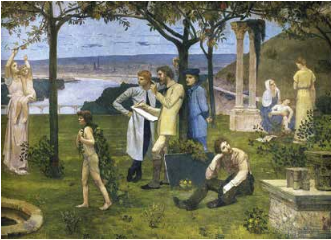
П. де Шаванн.

У 1874 р., задовго до суперечок про символізм і декаданс, Верлен написав вірш «Поетичне мистецтво». Проте опубліковано цей твір було 1882 р., тож читачі сприйняли його в контексті дискусії, розв'язаної статтею «Прокляті поети». Тим часом сам Верлен зазначав, що «не створив теорії» і його «Поетичне мистецтво» – «зрештою, просто пісня». Цим віршем автор «відзначив» двохсотріччя однойменного трактату теоретика французького класицизму Н. Буало. Отже, «Поетичне мистецтво» Верлена – радше пародія на теорії. І єдине, що насправді проголошує його «маніфест», – це думка про те, що доба Буало, коли література була слухняною ученицею теоретиків, а тому надто вже «літературною», давно минула.