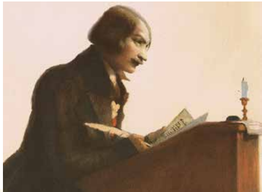
Ю. Коровін. Микола Гоголь. 1952 р.

бурзі на той час уже вирувало море «українського земляцтва». Однак відтоді «пихаті нащадки бояр» встигли отямитися й замислилися над тим, що час уже забрати в «хитрих хохлів» пальму першості в бюрократичних справах. Вони зрозуміли, що шлях до управління наймогутнішою в Європі державою проходить через сучасну європейську освіту.