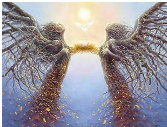
Т.А. Капера. Інші світи. 2011 р.

Шлях до розуміння художнього твору той самий, як і до опанування будь-якої нової думки: через хибне розуміння до визнання свого нерозуміння, і тоді вже – до справжнього розуміння. Роль помилки в культурі – перетворення чужих цінностей на індивідуальний досвід.