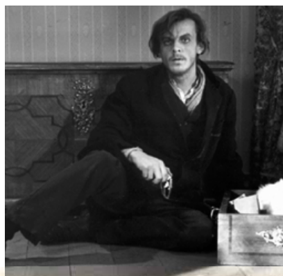
Г. Тараторкін у ролі Раскольниковова. Кадр із кінофільму «Злочин і кара» (режисер Л. Куліджанов, 1969 р.)