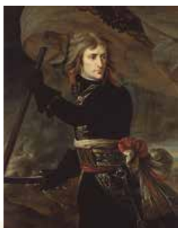
А.Ж. Гро. Наполеон Бонапарт на Аркольському мості. 1796–1797 рр.

А проте поет говорить «ми». Це означає, що піднятися над своєю добою можна, але її мрії, її кумири вимагатимуть свідомого ставлення до себе або впливатимуть на підсвідомість. Тож Пушкін пише вірш «Герой», у якому Наполеон відвідує своїх солдатів у чумному шпиталі. Поет хоче позбавити героя романтизму демонічної байдужості до людини: « Оставь герою сердце! Что же // Он будет без него? Тиран... ».