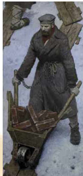
Г. Коржев. Достоевський на каторзі. 1986–1990 рр.