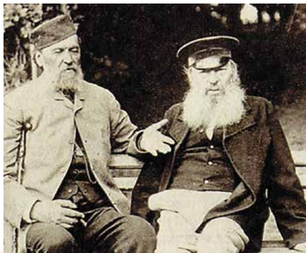
А. Фет з другом юності поетом Я. Полонським. Фото 1890 р.