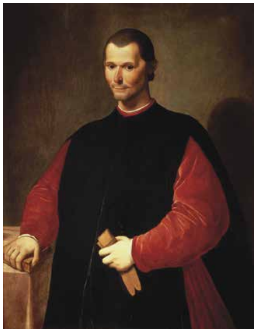
C. di Tito. Нікколо Макіавеллі. 1606 р.

5. Не бути «сопілкою» ані в руках долі, ані в руках людей – один з важливих ідеалів індивідуального буття доби пізнього Відродження. Своєю «інструментом» – душею – ренесансна людина прагнула володіти віртуозно й неподільно. Серед монархів XVI ст. вельми популярною була книжка «Державець» італійського письменника, політика, засновника наукової політології Нікколо Макіавеллі (1469–1527). У цьому посібнику для державних діячів є, зокрема, такі слова: « Державець повинен оволо-