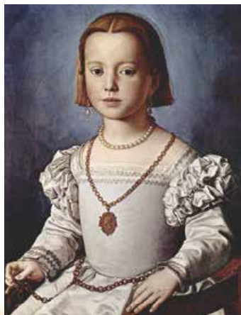
А. ді Бронзіно. Портрет Ізабелли Медічі. 1552–1554 рр.