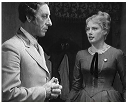
Кадр із кінофільму «Злочин і кара» (режисер Л. Куліджанов, 1969 р.)