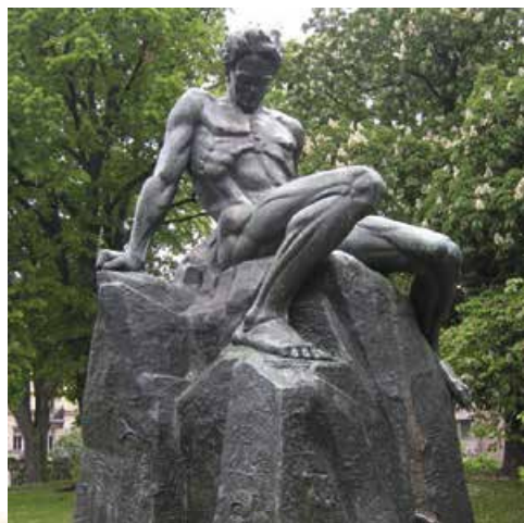
К. Ельд. Пам'ятник А. Стріндбергу. Стокгольм. 1942 р.