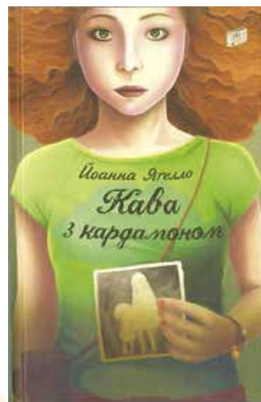
Обкладинка українського видання роману «Кава з кардамоном». 2013 р.