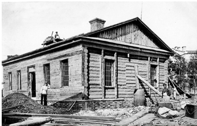
Караульне приміщення в Омській фортеці

Отже, «Сибір. На березі широкої, пустинної ріки стоїть місто, один з адміністративних центрів Росії; у місті фортеця, у фортеці тюрма».