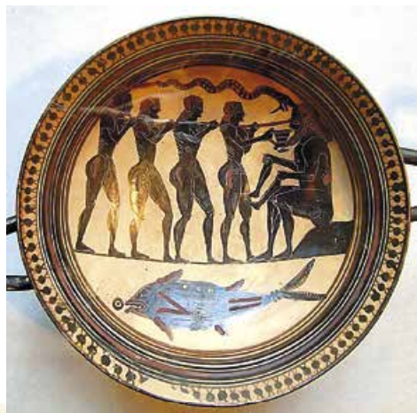
Одисей засліплює циклопа Поліфема. Таріль з Лаконіки, середина VI ст. до н.е.

Адже й Гектор з Ахіллом воюють не між собою (Ахілл так і говорить: «Троянці мені не вороги»). Вони намагаються гідно поводитися в житті, де все залежить від волі богів. Що ж до Одисея, то він мусить протистояти надприродним силам, які, здавалося б, перемогти неможливо. Так, циклоп Поліфем, якого герой позбавив єдиного ока, – син Посейдона. Осліпивши його, Одисей фактично кинув виклик морській стихії, від якої найбільше залежав. І зробив це весело, дотепно, з глибоким філософським підтекстом.