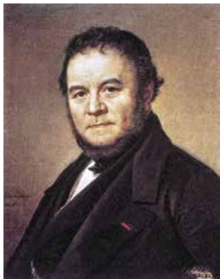
О.Й. Содермарк. Портрет Стендаля. 1840 р.

Відтак повернімося до розмови про автора одного з перших соціально-психологічних романів Стендаля. Важко повірити, але за життя твори цього надзвичайно популярного в ХХ ст. письменника ніхто не хотів ані друкувати, ані купувати. Отож митець змушений був служити чиновником і писати «в шухляду».