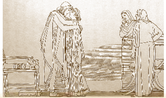
Дж. Флакман. Одіссей і Пенелопа. 1792–1793 рр.

Епічній поемі притаманний так званий епічний стиль оповіді .