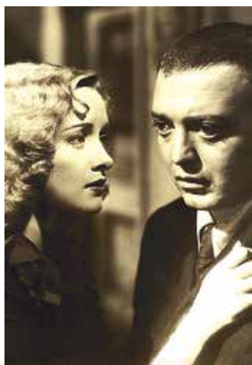
Кадр із кінофільму «Злочин і кара» (режисер Дж. фон Штенберг, 1935 р.)

Отже, після розмови з Мармеладовим Раскольніков читає лист матері, де йдеться про майбутній шлюб його сестри Дуні з Лужиним. За допомогою заміжжя Дуня сподівається розв'язати матеріальні проблеми своєї сім'ї так само, як Соня, торгуючи власним тілом, намагається підтримати своїх рідних. Тут героєві пригадується вислів Мармеладова «доведеться чистоти пильнувати» . «Любові тут не може бути, пише матуся. А що, коли, крім любові, ще й поважання не може бути, а, навпаки, вже є відраза, гидливість і зневага, що ж тоді? А й виходить тоді, що знов-таки, “чистоти пильнувати” доведеться. Чи не так, скажете? Розумієте, розумієте, розумієте ви, що означає ця чистота? Чи не розумієте ви, що лужинська чистота однакова, що й Сонеччина, а може, навіть і гірша, паскудніша, підліша, бо ви, Дунечко, все ж таки на якийсь комфорт покладаєте надію, а там просто про голодну смерть ідеться!»