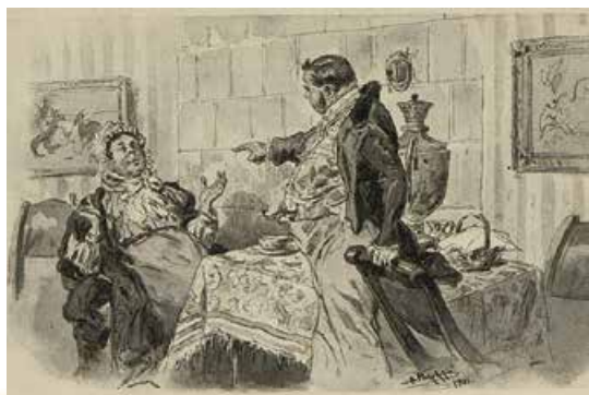
В. Маковський. Чичиков і Коробочка. 1901–1902 рр.