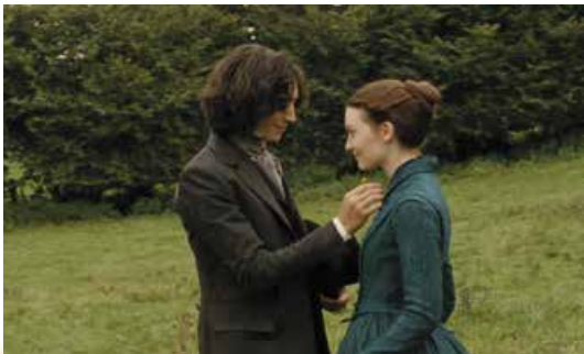
Кадр із кінофільму «Пані Боварі» (режисер С. Бартез, 2014 р.)

Так міф породжує ритуал, ритуал стає модним, а з моди виростає обов'язок, який породжує ще один міф, – наприклад, про те, що «завжди повинна» робити жінка. Потрапляючи до цього зачарованого кола, людина швидко втрачає волю, здатність на власні живі почуття.