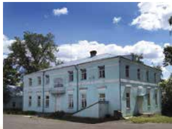
Будинок-музей А. Фета у Воробйовці