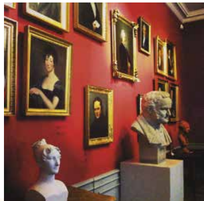
Музей Стендаля в Греноблі

Анрі Марі Бейль (справжнє ім'я Стендаля) народився у французькому місті Греноблі в сім'ї адвоката судової палати. У сім років майбутній письменник утратив матір. Проте образ цієї мрійливої, тендітної жінки, якій важко було миритися з грубістю, зарозумілістю й холодною педантичністю чоловіка, назавжди залишився в його серці. До речі, герої з характерами батьків є в більшості художніх творів Стендаля (у «Червоному і чорному» це подружжя де Реналь).