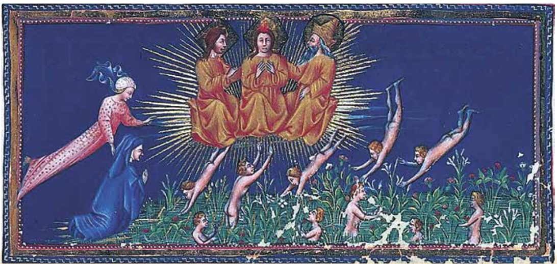
Дж. ді Паоло. Беатріче несе поета увись до Святої Трійці. 1440-ві роки

Настає момент, коли подальше сходження Вергілія горою чистилища стає неможливим: за життя він був язичником, тому не годен наблизитися до християнського Бога. Відтак Данте поведе Беатріче. Сходження перетворюється на політ, землю заступає небо, із чистилища поет потрапляє в Рай. Отже, любов не лише «водить сонце й зорні стелі» – вона є найкращою вчителькою і творцем. Однак у листі до друга і покровителя, володаря Верони Кангранде делла Скала, автор «Божественної комедії»