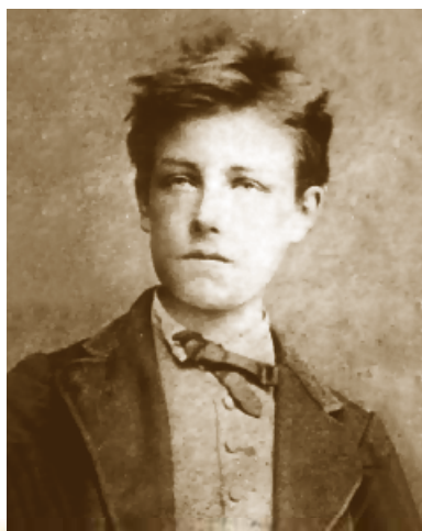
Е. Карж. Фотопортрет А. Рембо