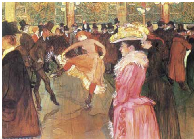
А. де Тулуз-Лотрек. Танок у «Мулен Руж». 1890 р.

Ми вже згадували, що 1871 р. Рембо познайомився з П. Верленом. Упродовж їхніх мандрів Бельгією та Англією (1872–1873) Артюр створює поезії, що увійшли до збірки «Останні вірші», та збірку віршів у прозі «Осяяння». У 1873 р., після фатальної сутички з Верленом, Рембо завершує роботу над книжкою «Літо в пеклі» й намагається її опублікувати – певний час безуспішно. Він ще не знає, що ця збірка поезій у прозі стане останнім подихом його натхнення. Не знає і того, який потужний відгук і яке тривале продовження отримає його теорія «поета-ясновидця» у французькій, а надалі й у всій європейській літературі.