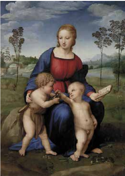
Рафаель. Мадонна зі щигликом. 1505–1506 рр.

Дивлячись на ренесансних мадонн, мимоволі замислюєшся: де художники бачили таких жінок, таких дівчат? Невже тільки в уяві? Хочеться вірити, що ренесансний ідеал жінки був із плоті й крові. Принаймні Гамлет, на високій ноті завершуючи свій монолог, у це вірить. Так само хочеться сподіватися, що Лаерт не був надто суб'єктивним, стверджуючи, ніби Офелія з вершини часу кидає йому виклик своєю досконалістю: « Stood challenger on mount of all the age // For her perfections ».