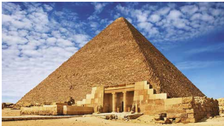
Піраміда Хеопса. Гіза

Кожна освічена людина знає, що найбільшою спорудою Стародавнього світу є піраміда Хеопса. Назву піраміди, тобто ім'я фараона, зберегли папіруси. Єгипетські жерці дбайливо їх відновлювали і вірили, що це триватиме вічно. Перш ніж час знищить папіруси, хтось знову перепише «священні» відомості. Цією людиною став... сам Геродот, завдяки якому ми й знаємо про того, кого поховано в найвищій піраміді.