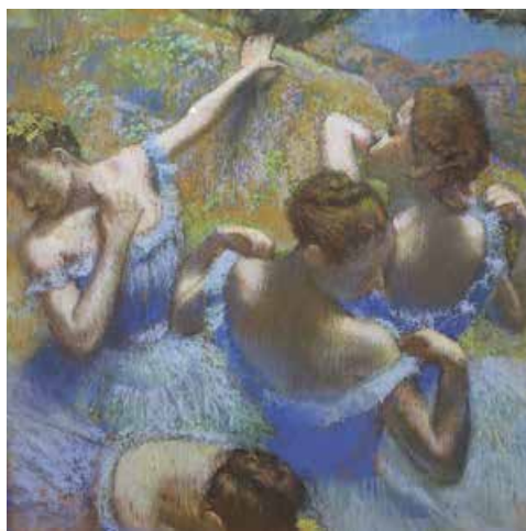
Е. Дега. Блакитні танцюристки. 1897 р.

Так музики ж всяк час і знов! Щоб вірш твій завше був крилатий, Щоб душу поривав – шукати Нову блакить, нову любов,