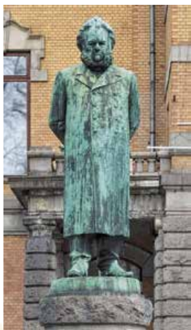
С. Сіндінг. Пам'ятник Г. Ібсену. Осло. 1899 р.

Зокрема, Б. Шоу сформулював сутність нової реалістичної драми так: «Ми самі в наших власних обставинах». ▼▲▼