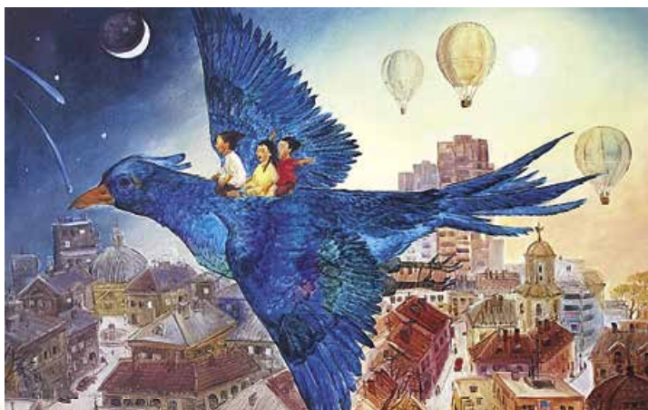
Х. Шимова. У краї синього птаха. 2004 р.

Батько не підтримав вибору Моріса, адже вважав, що син мусить здобути юридичну освіту і працювати в галузі права, а любов до містики й давнини можна реалізувати й на дозвіллі. Отож після закінчення єзуїтського колежу Моріс протягом 1881–1885 рр. вивчав право в Гентському університеті, а потім три роки працював у рідному місті адвокатом. І попри все, від 1889 р., коли вийшли друком і здобули високу оцінку преси його перша поетична збірка «Тепличні квіти» та перша п'єса «Принцеса Мален», Метерлінк назавжди присвячує себе літературі.