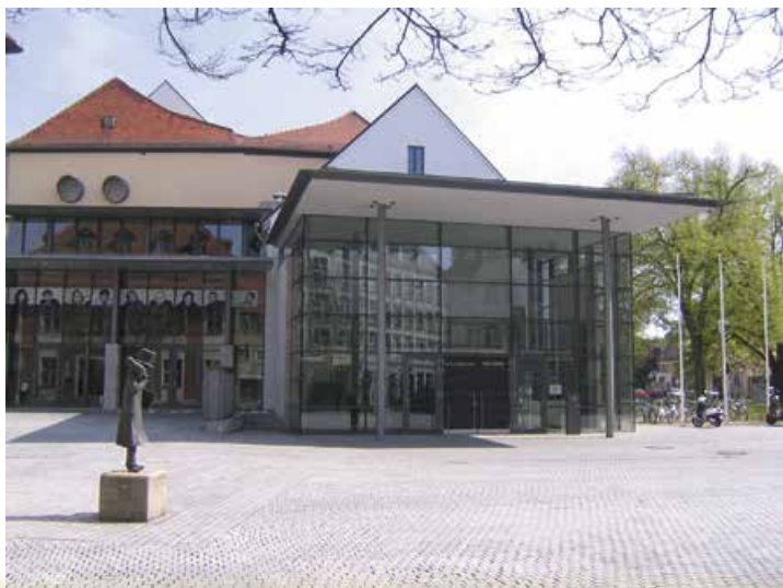
Театр Е.Т.А. Гофмана та пам'ятник письменнику. Балберг

У 1798 р. обдарований музикант, художник і письменник (автор двох романів, які згодом загубилися) вирушив шукати роботу до Берліна, а невдовзі як дрібний урядовець виїхав до Польщі, щойно розділеної між Пруссією, Австрією та Росією. Там на Гофмана чекав успіх. У вільний від служби час він написав комічну оперу та месу для скрипки й органа. У 1802 р. митець одружився з польською панянкою Михалиною Рорер-Тшцинською, яка стала йому вірною подругою і опорою в житті.