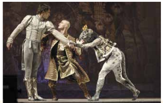
Сцена з вистави «Лускунчик». Театр «Київ модерн-балет». 2017 р.