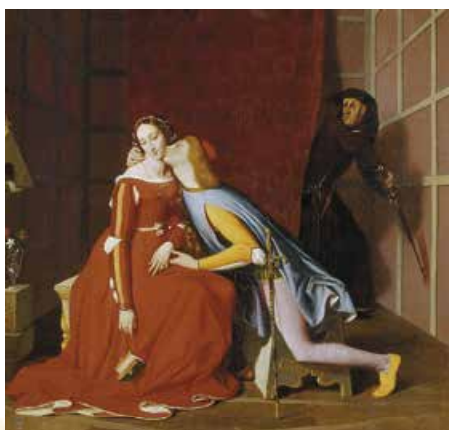
Д. Енгр. Паоло і Франческа. 1819 р.