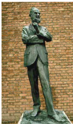
П. Трубецькой. Пам'ятник Б. Шоу. Дублін