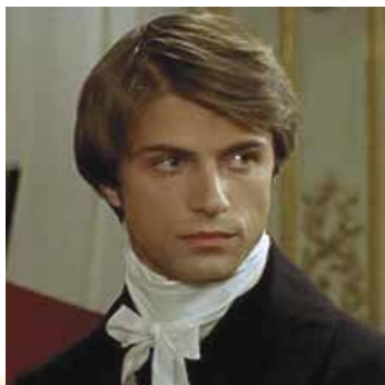
Жульєн Сорель у виконанні К.Р. Стюарта

Багата спадкоємиця, яку віддали заміж у шістнадцять років, дружина мера містечка Вер'єра пані де Реналь статками й суспільним статусом не хизується. Вихована в єзуїтському монастирі, до моменту фатальної зустрічі з Жульєном Сорелем вона зберегла «мирну душу», «вільне від будь-якого кокетства й облуди» серце і «справжню чарівність», яка «є природним даром».