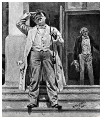
В. Маковський. Манилов. 1901–1902 рр.