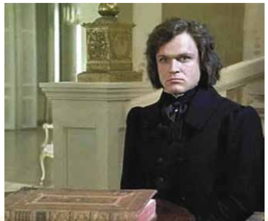
Кадр із кінофільму «Червоне і чорне» (режисер С. Герасимов, 1976 р.)