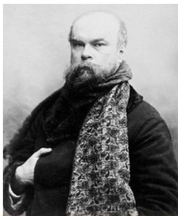
Фотопортрет П. Верлена