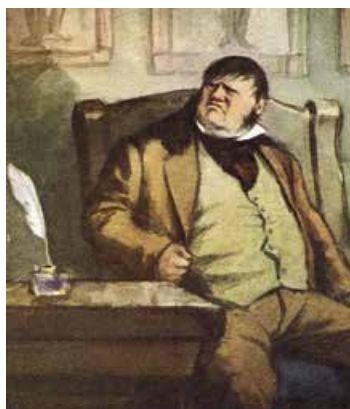
Кукринікси. Собакевич. 1952 р.