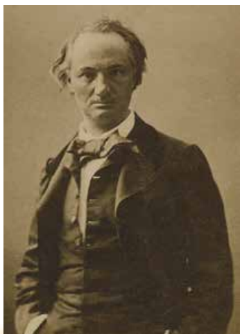
Надар. Фотопортрет Ш. Бодлера

Повернувшись додому вже повнолітнім, Бодлер отримав батьків спадок і заходився його витрачати. Він розірвав усі контакти з матір'ю та вітчимом і, за модою тодішніх митців, винайняв романтичну квартиру «в мансарді» (на горищі). Усі друзі Шарля так чи так були причетні до мистецтва і належали, за його словами, до «покоління молодого, серйозного, насмішкуватого й загрозливого». Усі вони, як і Шарль, ненавиділи «буржуазію», до якої, незалежно від походження, зараховували своїх благополучних батьків. Духовним виявом антибуржуазного бунту