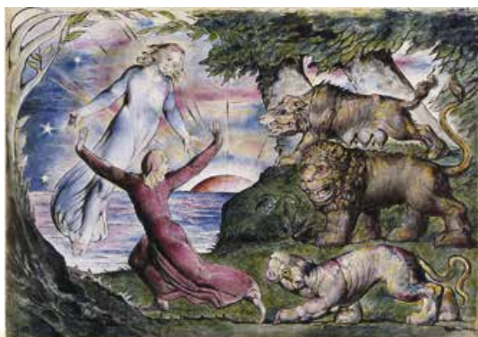
В. Блейк. Вергілій, Данте і три звіра. 1826 р.

Неважко здогадатися, що образи в цьому фрагменті «Божественної комедії» мають алегоричне значення . І не надто важливо, яке саме. Досить розуміти, що звірі – це певна перешкода на шляху поета до очищення й пізнання Бога («я зневірився зійти горою»). Тим часом Данте вкладав у ці образи конкретний алегоричний зміст. Пантера – алегорія хтивості, обману ; лев – алегорія гордині , найстрашнішого християнського гріха, насильства ; вовчиця – алегорія жадібності й користоловства . Однак ідеться також про інший алегоричний ряд: пантера – алегорія олігархії , лев – тиранії , вовчиця – світської влади римської церкви . Християнин Данте чітко розділяв церкву як політичну інституцію і як утілення Божественної справедливості. Це був погляд, загалом не притаманний середньовічній людині, тож митця по праву вважають не лише останнім поетом Середньовіччя, а й першим поетом Відродження. Адже саме добі Відродження властиві спроби гармонізувати світ, як у пору античності.