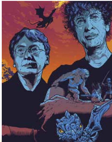
Т. Макдонах. Кадзуо Ішігуро та Н. Гейман. 2015 р.

Н. Гейман народився в місті Портчестері (Велика Британія) 1960 р., але у віці тридцяти двох років переїхав до США. Після закінчення школи Ніл точно знав, чого хоче досягти в житті. Він знехтував вищою освітою і обрав професію журналіста. Перші результати з'явилися тільки через шість років, коли було опубліковано перше інтерв'ю Геймана. Письменник знову змінив світ навколо себе в 1984 р., опублікувавши своє перше оповідання.