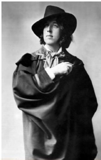
Фотопортрет О. Уайльда. Бл. 1876 р.

Уже в цих двох казках простежується центральна тема творчості Уайльда – краса та потворність тіла й душі. Усе своє творче життя митець намагався відповісти на запитання, що таке справжня краса. Чи може бути насправді красивою вродлива людина без серця? Що відчуває