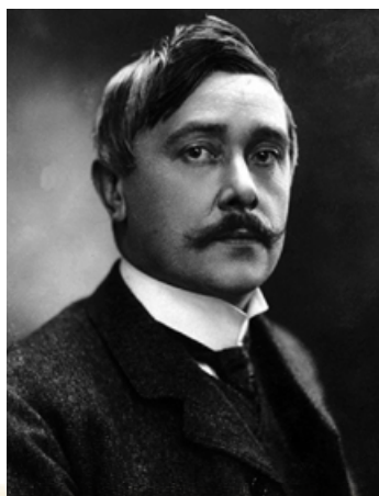
Фотопортрет М. Метерлінка