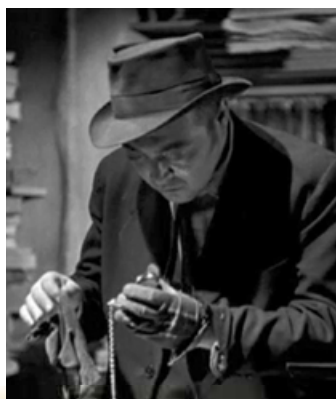
П. Лорре в ролі Раскольниковова. Кадр із кінофільму «Злочин і кара» (режисер Дж. фон Штенберг, 1935 р.)