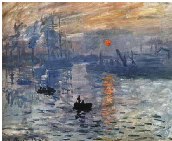
К. Моне. Схід сонця в Гаврі. Враження. 1872 р.