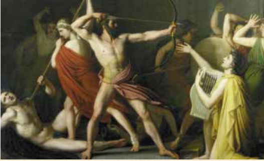
Т. Дежорж. Одіссей і Телемах убивають наречених Пенелопи. 1812 р.

логії обидві Гомерові поеми втілюють тему загибелі покоління героїв. Отже, фінал «Одіссеї» – це спільний фінал обох епопей. І те, що насамкінець має відчутти слухач, – це сум за епічними часами, коли люди були могутніми героями й усупереч егоїстичним інтересам прагнули якнайкраще виконати «волю богів», водночас залишаючись людьми, гідними поваги нащадків.