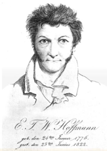
Автопортрет Е.Т.А. Гофмана. До 1820 р.

Ернст Теодор Амадей Гофман (1776–1822) змалечку так захоплювався музикою видатного австрійського композитора Моцарта, що змінив своє третє ім'я, Вільгельм, на одне з його імен. Сам Гофман народився в сім'ї пруського адвоката на берегах Балтики, у Кенігсберзі (Східна Пруссія, нині – російське місто Калінінград). Коли Ернст був студентом юридичного факультету Кенігсберзького університету (1792–1795), на філософському факультеті цього закладу працював видатний мислитель Іммануїл Кант. Однак Гофман філософією не захоплювався (як, до речі, і своїм майбутнім фахом – правознавством). Він, як ви вже знаєте, був закоханий у музику.