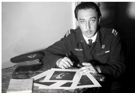
Фотопортрет Романа Гарі. 1960-ті роки

Ромен Гарі був із тих чоловіків, які, забувши про амбіції та марнославство, усі свої блискучі перемоги й героїчні жертви присвячують жінкам. Ще в дев'ять років він зустрів своє перше кохання – ровесницю Валентину. Якось дівчинка між іншим зауважила: «Янек з'їв заради мене всю свою колекцію марок». Невідомо, чи й справді і чи всю колекцію з'їв Янек, а от Роман, почувши від коханої такі слова, тут-таки запхав до рота цілу калашу (і, звісно, потрапив до лікарні). На пам'ять про цей епізод з автобіографічного роману «Обіцянка на світанку» (1960) у Вільнюсі 2007 р. встановили пам'ятник.