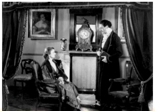
Кадр із кінофільму «Мадам Боварі» (режисер Ж. Ренуар, 1933 р.)