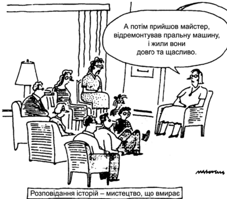
Карикатура М. Стівенса