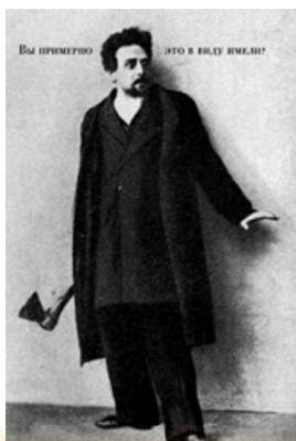
П. Орленев у ролі Раскольниковова. Кадр із кінофільму «Злочин і кара» (режисер І. Вронський, 1913 р.)