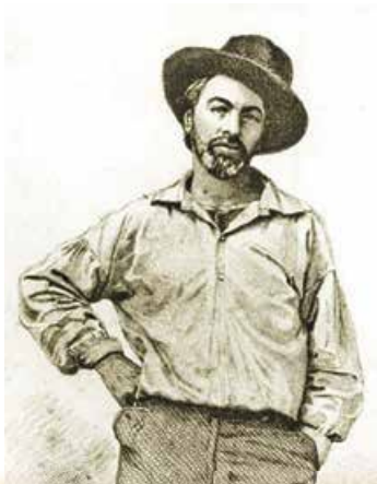
С. Холліер. Портрет В. Вітмена. 1854 р.

Простежуючи історію «поетичної революції», що змінила місце поета й поезії у світі, мусимо вирушити за океан. Саме там, на Північноамериканському узбережжі Атлантики, у дружній фермерській сім'ї Вітменів, нащадків англійських і голландських переселенців, з'явився на світ син Волт – у майбутньому видатний американський поет Волт Вітмен (1819–1892) .