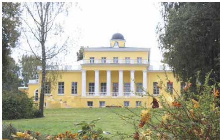
Музей-маєток Ф. Тютчева «Овстуг» на батьківщині поета. Брянська область