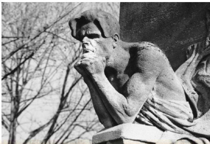
Ж. де Шармуа. Пам'ятник Ш. Бодлеру на цвинтарі Монпарнас. Париж. 1902 р.