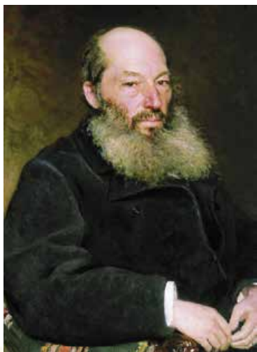
І. Рєпін. Портрет А. Фета. 1882 р.

Між іншим, Фет наполягав на тому, що й байдужим до мистецтва варто хоч іноді замислюватися над існуванням «чистої краси». У статті «Про поезії Тютчева» він писав: «Краса розлита по всьому світу і, як усі дари природи, впливає навіть на тих, хто її не усвідомлює, так само, як повітрям дихає і той, хто, може, й не підозрює про його існування».