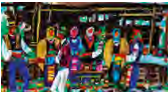
Ю. Сташко. На ярмарку

Серед найуживаніших просторових прийменників такі: в (у), на, з (зі, із), за, по, до, від, через, над, під, біля. Їх значення наведені в таблиці.