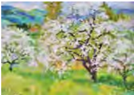
А. Калитко. Сад цвіте

То сади цвіли. Ой же й хороша пора року! Та в таку пору як хотілося б, аби люди всіх країн світу облишили свої свари, аби милувалися прекрасним витвором своїх рук і природи. Бо що може бути чудеснішим за цвіт яблуні?! Дивися на нього й тішся найніжнішими його пахощами, багатством фарб і тонів, заслуховуйся шепотом молодого листа. Адже яблуні цвітуть лише раз на рік! (С. Завгородній).