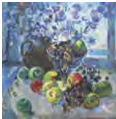
В. Ерліх. Натюрморт

Вправа 67. Перепишіть, уставляючи на місці крапок, де потрібно, м'який знак. Усно поясніть правопис. За потреби звертайтеся зі словником іншомовних слів.