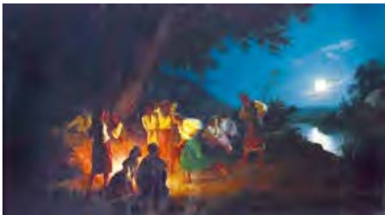
Г. Семирадський. Ніч на Івана Купала

Зранку на Купала дівчата йдуть у поле або в ліс збирати трави й квіти, з них плетуть вони для себе купал..ські вінки, у вінках повинен бути й полин; крім того, вони носять полин увесь день у себе під рукою; це охоро(-н,-нн-)ий засіб від русалок та від..ом.