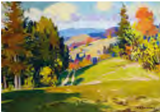
З. Шолтес. Осінь у Карпатах

III. Напишіть міні-твір на тему «Карпати на порозі осені», вводячи в текст утворені сполучення слів і дієслова з префіксами, що передають просторові відношення.