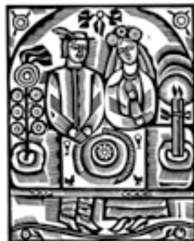
В. Перевальський. Молодий і молода. Гравюра

Б..юргер, Б..єрнсон, Ксав..є, деб..ют, п..юпітр, круп..є, п..юре, П..єр, куп..юра, М..юнхен, ком..юніке, ф..юрер, п..єса, валер..яна, Ендр..ю, кар..єр, кутюр..є, тр..юк, Фур..є, Олів..є, б..язь, деб..ют, б..юлетень, б..юст, грав..юра, Рів..єра, інтер..єр, кр..юшон, кур..єр, капіл..яр, карб..юратор, ф..юзеляж, рев..ю, вар..єте, к..ювет.