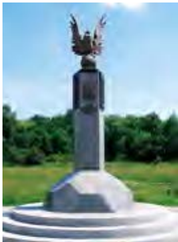
Пам'ятний знак «110 років українського футболу», м. Львів

приблизно 800 (рік) тому. У містах Англії у футбол грали спочатку на базарних площах і навіть на кривих і вузьких вуличках тогочасних міст.