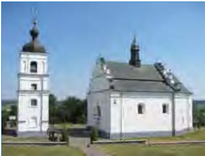
Церква в Суботові, збудована в стилі раннього українського бароко. 1651–1656 рр.

Українська мовна традиція сягає далеких докняжих часів, а в період Київської Русі українське слово набуло державної ваги: воно було відкрите не лише для близьких сусідів, а й для найвіддаленіших земель, збагачувалося іншими мовами й саме збагачувало їх. Його розвитку не могли зашкодити ні чвари, ні міжусобиці, ні феодална роздробленість, ні багатівкове монголо-татарське іго. Його не стяла шабля, не затоптали в болото кінські копита, не розвіяв вихор навальних орд... Горіли хроніки, храми і святі книги, а слово вийшло з вогню, як заповіт, стало сімлю землі й народу. Гнане, принижене й занепащене, воно ніколи не відчувало себе як у полоні-безвиході. Воно начеб чекало великої пори. І вона настала: велика пора формування української нації.