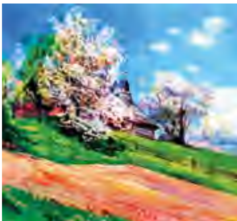
I. Шутев. Квітуха Верховина

З-під снігу зазеленіла травиця, звеселила жайворонка. Звився жайворонок високо в небо і заспівав про те, що мертва земля ожила знов, що сонце стало ласкавим, теплим, ясным, що набубнявіли на деревах бруньки, готуючись зеленим листом замаїти гаї та діброви ( М. Коцюбинський ).