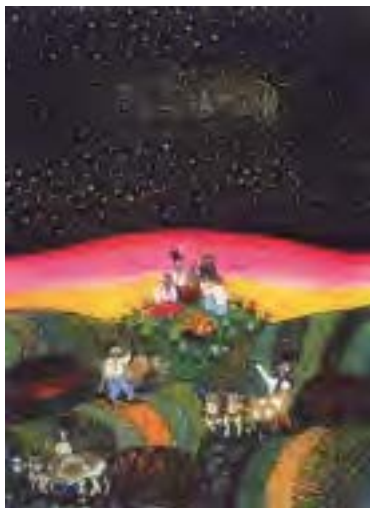
І. Сколоздра. Чумацький шлях

Вправа 93. Прочитайте речення. Випишіть у зошит ті слова, у яких відбувається чергування приголосних. Усно поясніть, за яким правилом відбувається чергування.