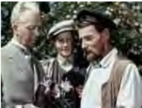
Кадр із фільму «Мічурін». Режисер О. Довженко. 1948 р.